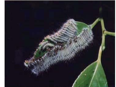
チャドクガの若齢幼虫の集団

そこで皆さんの中に、もしご希望の方がいらっしゃれば巡回予約をしていただければ大変助かります。